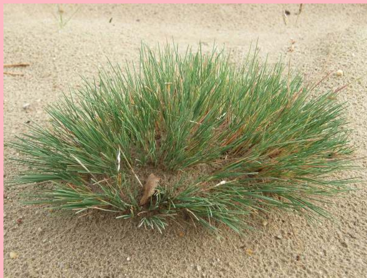
Paprastas, nelepus ir neišrankus "augalas-dzūkas" - Smiltyninis šepetukas (nuotraukos iš interneto).

Ir, aišku, negalėjau subtiliojo išvalgaus gamtininko nepaklausti, kas, jo manymu, yra tikrasis žemaitis? Ir ką gi, atsakymą gavau. Pasirodo, tai – į Lietuvos raudonąją knygą įrašyta Raktažolė pelenėlė ( lot. Primula farinosa, angl. Bird's-eye primrose, vok. Mehlprimel ). „Saulės krislelis“, taip gražiai ji vadinama ne viename tekste. Lietuvoje - apyretė, sparčiai nykstanti rūšis (tikriausiai, ne todėl, kad nykstanti, ji vadinama žemaičių? 😊)