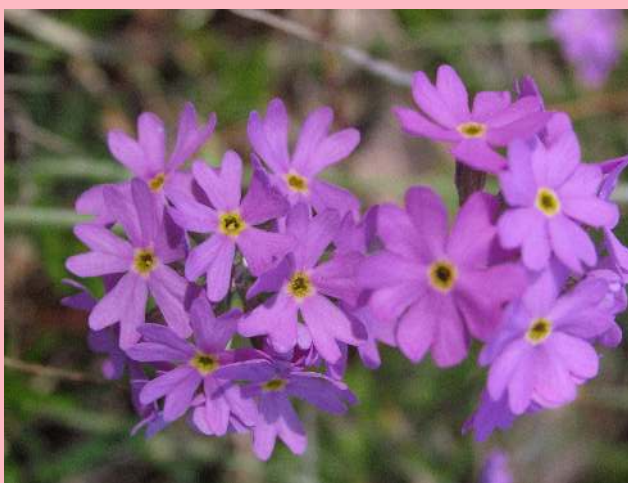
Raktažolė - pelenėlė - subtiliai spindintis "saulės krislelis". Toks, greičiausiai, ir yra tikras žemaitis? (nuotrauka iš interneto).

Ir, aišku, negalėjau subtiliojo išvalgaus gamtininko nepaklausti, kas, jo manymu, yra tikrasis žemaitis? Ir ką gi, atsakymą gavau. Pasirodo, tai – į Lietuvos raudonąją knygą įrašyta Raktažolė pelenėlė ( lot. Primula farinosa, angl. Bird's-eye primrose, vok. Mehlprimel ). „Saulės krislelis“, taip gražiai ji vadinama ne viename tekste. Lietuvoje - apyretė, sparčiai nykstanti rūšis (tikriausiai, ne todėl, kad nykstanti, ji vadinama žemaičių? 😊)